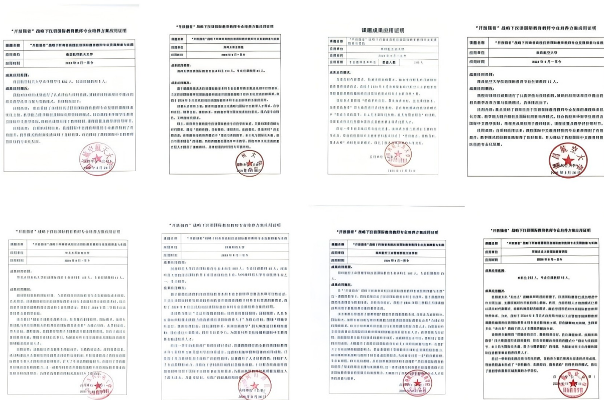
图 7 推广应用证明

1. 国内高校广泛推广应用。 成果凭借清晰的逻辑架构与实操性强的落地方案，已被南京航空航天大学、郑州大学等国内 8 所不同类型高校参考借鉴，并实现阶段性推广落地，直接惠及师生 3000 余人，间接受益师生 12000 余人。各高校结合办学特色差异化应用：南京航空航天大学汉语国际教育专业近年以“中文+三航”学科融合、AI 智慧教学、沉浸式文化实践、国际化师资与平台建设为核心，形成鲜明的工科特色与技术赋能的发展路径；郑州大学增设“中原文化海外传播”课程模块，融入豫剧、黄河文化等特色资源，相关课程学生海外教学满意度达 90%；华北水利水电大学打造“汉语+科技”复合培养方向，毕业生在水利类海外项目中文服务岗位竞争力显著提升，相关岗位就业率提升 25%；河南师范大学依托“认知—模拟—实战”三级实践链，有效解决实践场景单一问题，学生校外实践时长达标率提升约 18%。