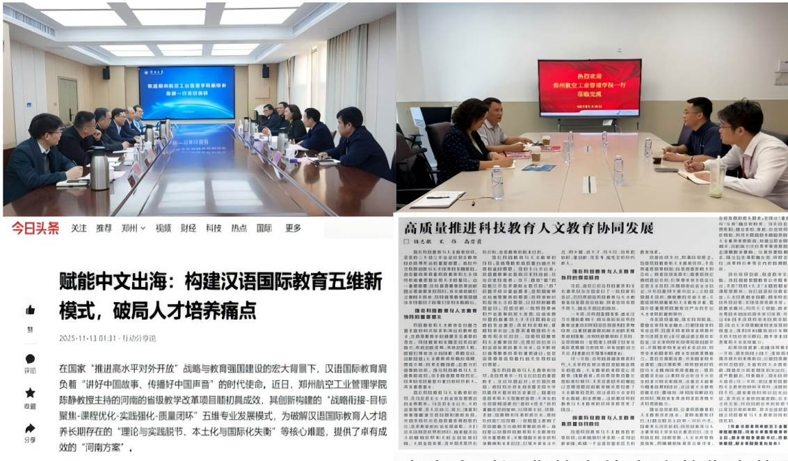
图8 成果交流及传播

校汉语国际教育专业改革成果研讨会”，分享的培养方案、课程体系等经验获广泛认可。依托成果，应用高校成功申报省级及以上相关教改课题6项，形成“成果推广—经验转化—课题深化”的良性循环。相关经验被光明日报、中国教育网等权威媒体报道，累计阅读量超10万人次，获得河南省教育厅、孔子学院总部等教育主管部门及行业企业的高度认可，成为地方高校专业改革服务区域战略的典型范例。