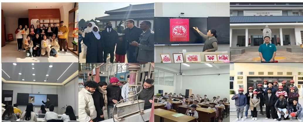
图 6 社会服务剪影

2. 社会服务价值精准落地。 深度对接河南“开放强省”战略，累计为河南海外文化中心、孔子学院输送优质师资 30 余人，成为中原文化海外传播的重要力量；为河南国际集团、宇通集团等 10 余家重点外向型企业培训外籍员工 1000 余人次，有效解决企业外籍员工沟通障碍，助力海外业务拓展。组织“中原文化展示”等特色活动 10 余场，覆盖“一带一路”沿线 10 余个国家，受众超万人次，形成产学研用一体化格局，实现人才培养与行业需求同频共振。此外，专业建设基础持续夯实，实践基地从 3 家增至 11 家，数字化教学资源年均访问量显著提升，跨学科课程不断拓展，专业综合竞争力显著增强。